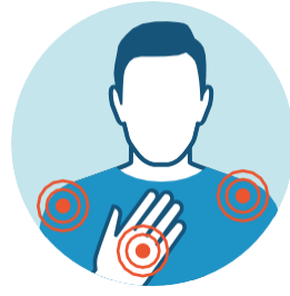
DOLOR MUSCULAR Y FATIGA