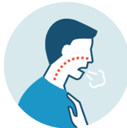
FALTA DE ALIENTO O DIFICULTAD PARA RESPIRAR