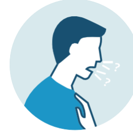
PÉRDIDA DE SABOR U OLOR