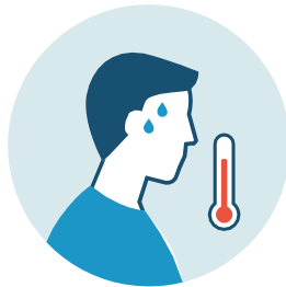
100°F DE FIEBRE

2 Otras señales de enfermedad tales como: