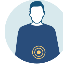
NÁUSEAS O VÓMITOS