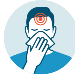
CONGESTIÓN Y FLUJO NASAL